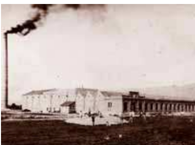
E. Offermann, Kammgarnspinnerei teilweise noch im Bau, 1896

Für die nach Hard geholten Trentiner ließ die Firma S. Jenny seit den 1890er Jahren Arbeiterhäuser in Fabriknähe bauen. Die ersten Arbeiterhäuser entstanden direkt am See