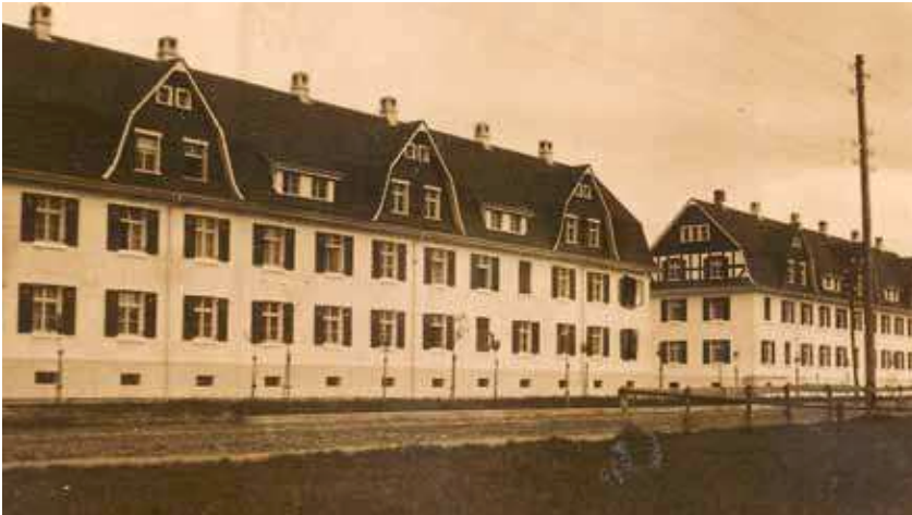
Jenny Wohnhäuser an der Landstraße, um 1911

bruchs in den letzten Vorkriegsjahren des Ersten Weltkrieges (1914-18) wanderten viele von ihnen in die prosperierende Kammgarnspinnerei ab oder kehrten in ihre Heimat zurück. Der Zuwachs von 25 Prozent der Harder Bevölkerung ging zwischen 1900 und 1910 vorwiegend auf das Konto der Kammgarn.